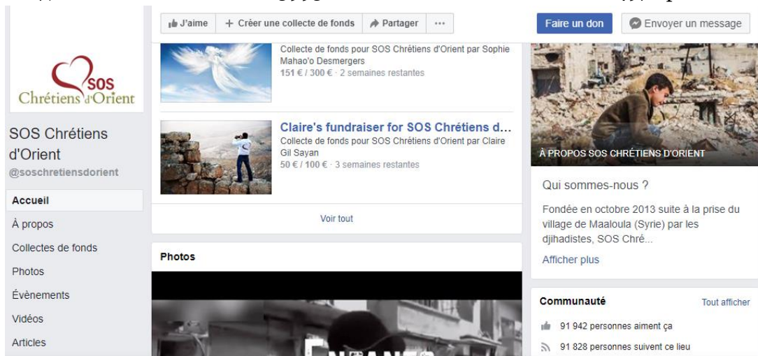
Capture d'écran – page Facebook SOS Chrétiens d'Orient