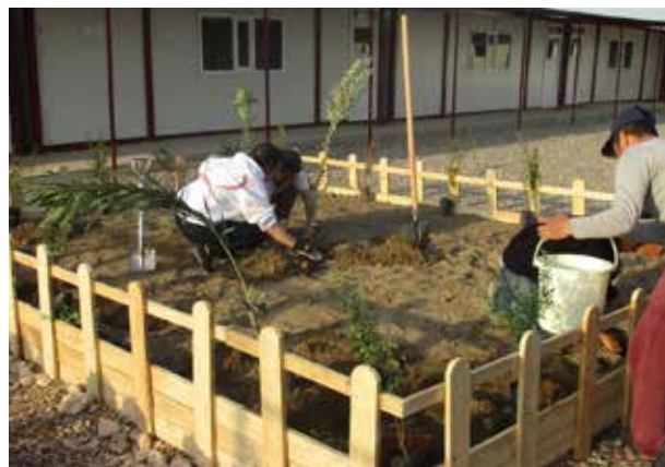
Les volontaires de SOS Chrétiens d'Orient participent activement à l'entretien de l'école d'Ankawa et de son jardin.

Les perspectives sont encourageantes. À court et moyen terme, les volontaires continueront de soutenir le fonctionnement de l'établissement tout en participant à l'amélioration des conditions de travail du personnel enseignant et des élèves. Par la suite, une fois la plaine de Ninive libé-