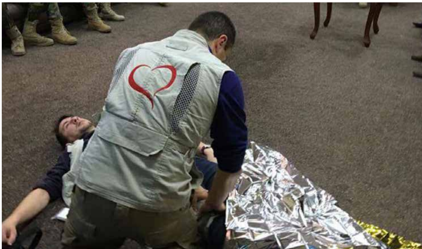
Un volontaire de la mission Irak donne des cours de secourisme aux soldats de la coalition qui s'apprentent à libérer la plaine de Ninive. C'est un grand honneur et une immense preuve de confiance pour SOS Chrétiens d'Orient de participer à cette mission cruciale.

J'étais moi-même récemment à Bagdad et à Kerbala. où le gouverneur de la province sainte chiite nous a fait l'honneur de nous recevoir et de nous faire part de son admiration pour le travail de SOS Chrétiens d'Orient. Il nous a invités à œuvrer dans sa ville. Cela montre bien qu'en étant un acteur de terrain exemplaire et pertinent, on peut faire avancer les choses. L'action sur le terrain avec les populations et les autorités locales demeure la plus grande force de SOS Chrétiens d'Orient. ■