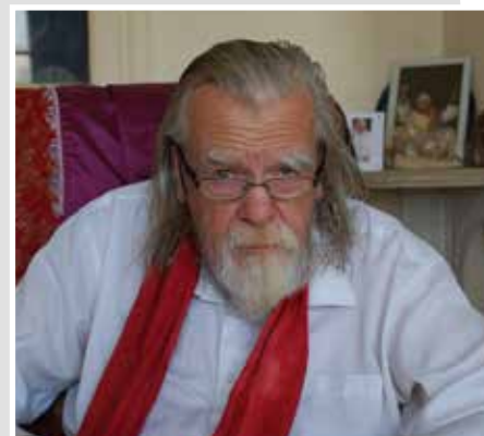
Le comédien Michael Lonsdale, César du meilleur acteur pour Des Hommes et des Dieux, a accepté de parrainer notre soirée de charité pour financer une école à Bagdad.

constituent donc des cibles de choix pour les terroristes. Plus de deux mille personnes ont répondu à l'appel de l'AED et de SOS Chrétiens d'Orient. Placée sous le haut patronage de Sa Béatitude Ignace Joseph III Younan, patriarche d'Antioche des syriaques catholiques, et de Jean d'Ormesson, de l'Académie française, la soirée était parrainée par des personnalités telles que l'écrivain Philippe de Villiers ou le comédien Michael Lonsdale. Après une séance de dédicaces avec près de vingt auteurs, un spectacle son et lumière a été projeté sur les murs des Invalides. Il retraçait l'histoire de la capitale à travers les siècles.