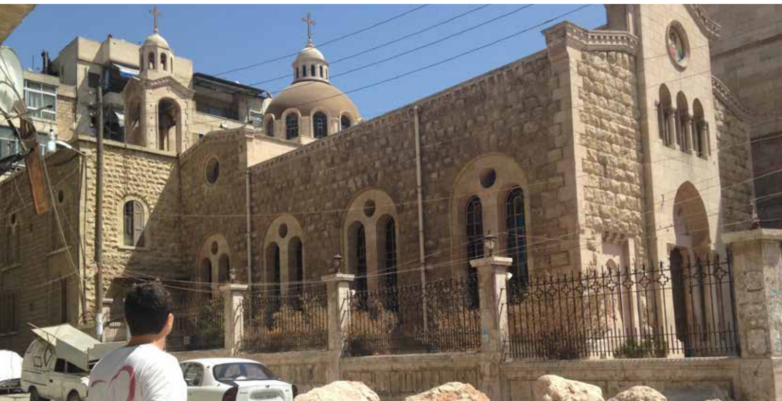
La cathédrale Notre-Dame-du-Perpétuel-Secours de Bagdad.