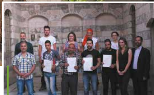
Les premiers diplômés de l'école d'architecture de Damas.

Un des intérêts des constructions traditionnelles est une meilleure adaptation aux contraintes du climat, rendant moins nécessaire l'usage d'air conditionné.